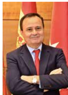
Ángel Viveros Alcalde de Coslada