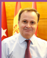
Ángel Viveros Gutiérrez Alcalde de Coslada