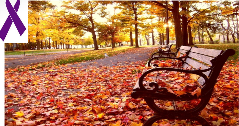
Ángel Viveros Gutiérrez Alcalde