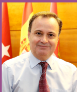
Ángel Viveros Gutiérrez Alcalde de Coslada