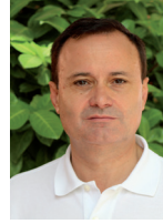
Ángel Viveros Alcalde de Coslada

Nuestra ciudad tiene argumentos suficientes para una celebración compartida: fue pionera en el ofrecimiento de un espacio político y administrativo para los niños y niñas; ha mantenido, a pesar de los cambios de gobierno municipal, el espíritu con el que nació y ha seguido creyendo en el proyecto superando las dificultades propias de lo que está vivo.