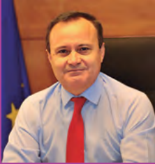
Ángel Viveros Gutiérrez Alcalde