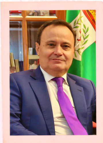
ÁNGEL VIVEROS GUTIÉRREZ ALCALDE AYUNTAMIENTO DE COSLADA