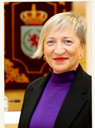
ÁNGEL VIVEROS GUTIÉRREZ ALCALDE AYUNTAMIENTO DE COSLADA