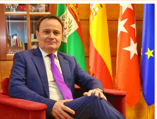
ÁNGEL VIVEROS GUTIÉRREZ ALCALDE AYUNTAMIENTO DE COSLADA