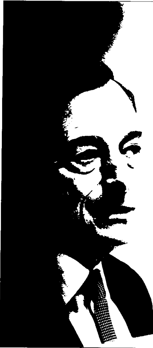
Mario Draghi, presidente del BCE, ayer, en Fráncfort

No hubo grandes sorpresas en las declaraciones de Draghi tras una reunión del consejo de gobierno de la entidad en lo que respecta a la compra de deuda pública en su mayoría, según las líneas de su programa de expansión cuantitativa (QE). El BCE sigue apostando por su política monetaria e insiste en los buenos resultados que se están empezando a ver, por lo que seguirá funcionando al menos